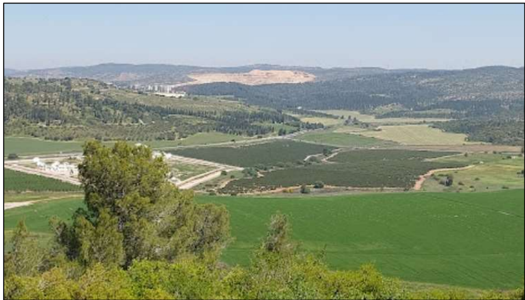
איור 9: נוף אסוציאטיבי ללא שרידים פיזיים בשטח - עמק האלה, מלחמת דוד וגוליית