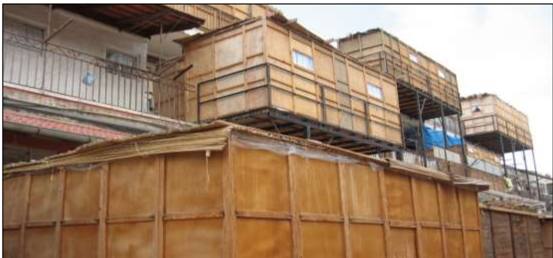
איור 7: נוף מורשת עיתי עירוני הנוצר בתקופת חג הסוכות בבני ברק

סוג נוסף של נופי מורשת הם נופים אסוציאטיביים . לרוב הם נופים טבעיים, ולעיתים בשטחים מיושבים, המקיימים אסוציאציות דתיות, היסטוריות, אמנותיות או תרבותיות בעלות עוצמה, גם כאשר לא מצויים בהם שרידים משמעותיים לפעילות אנושית. נוף אסוציאטיבי מזוהה באופנים רבים. הוא יכול להיות אתר מפורסם דוגמת הכותל המערבי או מצדה; הוא יכול להיות בעל חשיבות אישית, דוגמת גן שעשועים שהפרט בילה בו עם הוריו בילדותו, או המקום שחווה בו את הנשיקה הראשונה. מכלול של תכונות אישיות וידע אישי מכתביים במידה רבה את היווצרותם של נופים האלה. הנופים עשויים להתהוות