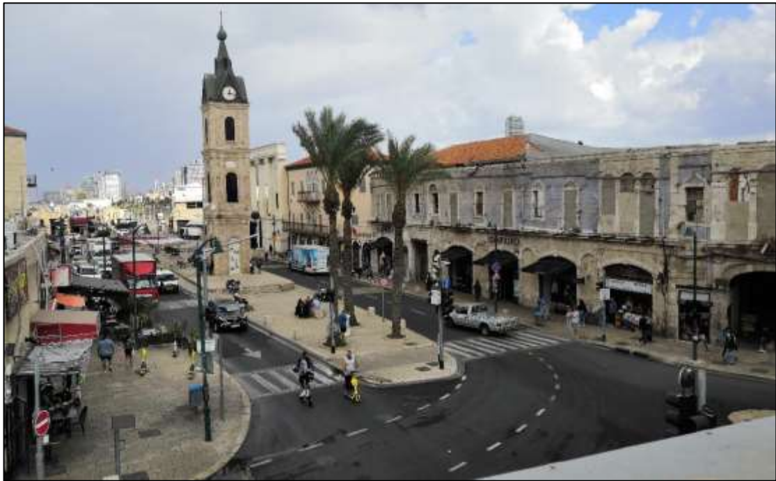
איור 4: נוף עירוני-היסטורי: כיכר השעון ביפו

נופי מורשת התרבות המוחשית הנפוצים יותר באזורים העירוניים הם ה נופים העירוניים-היסטוריים . אלה מכלולים של מבנים ובניינים שנוצרו במהלך ההיסטוריה המקומית. מכלולים אלה הם מרקמים עירוניים שנדבכיהם התרבותיים והטבעיים אינם מוגבלים לתיחום הגרעין ההיסטורי או לתיחום המוניציפאלי העירוני. דוגמאות לנופים אלה מוצגים באיורים 4 ו-5.