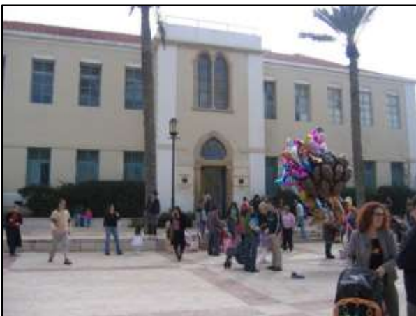
איור 12: בניין בית הספר הישן לבנות (1908) שהפך למוקד תיאטרון ופעילות תרבותית מגוונת

אתרים היסטוריים בסביבה העירונית יוצרים מתחמי בילוי, תרבות ותיירות ומוסיפים נדבך נוסף לרבדים המבונים של היישוב. בכך הם תורמים לכלכלת הרשות המוניציפלית בה הם מצויים. דוגמא למתחם בילוי ותרבות שהתפתח סביב שני בניינים היסטוריים סמוכים הוא מרכז סוזן דלל המוצג באיורים 11 ו-12 ומדגים את השימוש המגוון של הבניינים והרחבה סביבם.