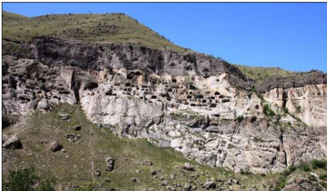
איור 2: נוף תרבות אורגני: ורדזיה, גיאורגיה - עיר המערות החצובות בהר

על פי האמנה להגנת המורשת העולמית של אונסקו (1972), נוף תרבות הוא נוף המייצג את "היצירה המשולבת של אדם וטבע". קיימת הבחנה בין נוף תרבות מעוצב - נוף שתוכנן ונוצר בידי אדם (למשל, הגנים הבהאים בחיפה ובעכו), לבין נוף תרבות אורגני - נוף המייצג תרבות, מסורת ואורחות חיים שהתפתחו באופן אורגני. להלן שתי דוגמאות לנוף תרבות אורגני (איורים 2 ו-3).