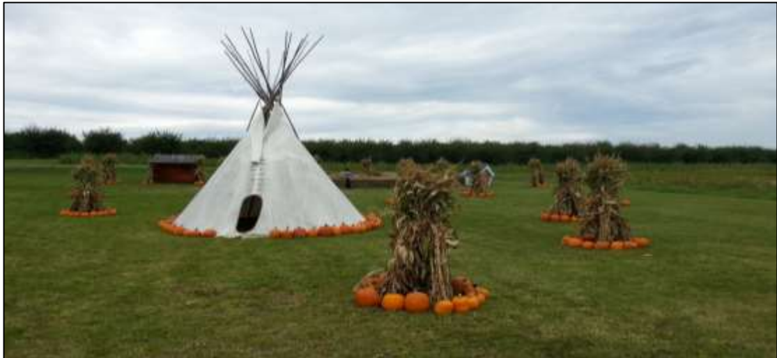
איור 6: נוף מורשת עיתי הנוצר במרחב הכפרי בתקופת "חג כל הקדושים" בצפון אמריקה

בנוסף לנופים הנוצרים על ידי נכסי מורשת תרבות מוחשית, ישנם נופים הנוצרים על ידי נכסי מורשת תרבות לא מוחשית שיש להם ביטוי בנוף, הן בנוף הבנוי והן בנוף הפתוח. נופים אלה הם ארעיים ברוב המקרים כיוון שהם קשורים לאירועים ומנהגים דתיים, למסורות של קרנבלים ומצעדים, לאירועי תרבות שונים ופסטיבלים הנהוגים במקום, וכיוצא בזה. ככלל, נהוג לכנותם נופי תרבות עיתיים . דהיינו, כאלה הנוצרים מעת לעת. דוגמאות לנופים אלה מוצגים באיורים 6 ו-7.