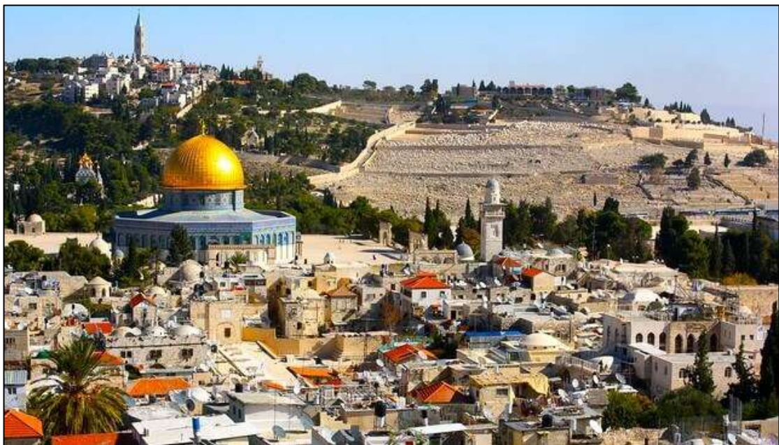
איור 5: נוף עירוני-היסטורי: העיר העתיקה והר הזיתים, ירושלים