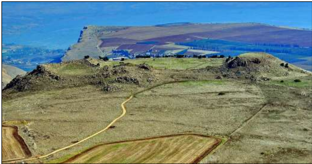
איור 8: נוף אסוציאטיבי עם שרידים בשטח (המבצר הצלבני) - קרני חיטין, סיפור הקרב בין הצלבנים למוסלמים

גם כאשר מצויים בשטח שרידים פיזיים הקשורים לאירוע מסוים, למשל הדוגמא המוצגת באיור 8, וגם כאשר לא נותר בשטח כל שריד פיזי, למשל הדוגמא המוצגת באיור 9.