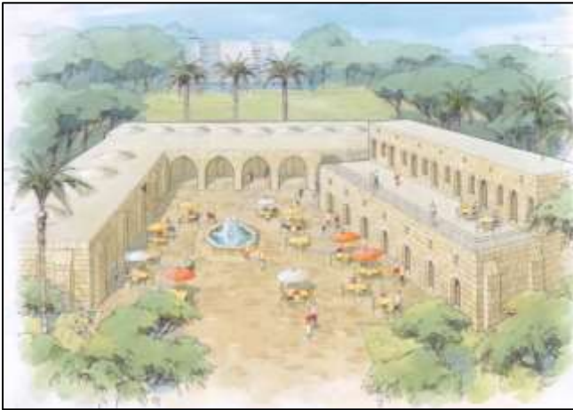
איור 14: תכנית רעיונית לשימור והפעלת ח'אן אל-חילו להסעדה ותיירות

ישנם גם מבני מורשת היסטוריים שלא זכו עדיין לשימור אך הם זכו כבר לתכנון רעיוני שישפיע על הסביבה העירונית ודרך פיתוחה. דוגמא אחת לכך היא ח'אן אל-חילו בלוד שאת סביבתו ניקו לאחרונה והוא ממתין לתקציבי הפיתוח והשימור (ראה איורים 13 ו-14).