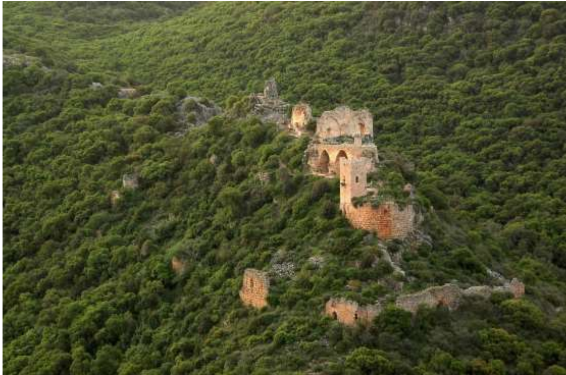
איור 10: מבצר המונפורט המוכרז כגן לאומי בתוך שמורת הטבע נחל כזיב

אתרים היסטוריים בסביבה העירונית יוצרים מתחמי בילוי, תרבות ותיירות ומוסיפים נדבך נוסף לרבדים המבונים של היישוב. בכך הם תורמים לכלכלת הרשות המוניציפלית בה הם מצויים. דוגמא למתחם בילוי ותרבות שהתפתח סביב שני בניינים היסטוריים סמוכים הוא מרכז סוזן דלל המוצג באיורים 11 ו-12 ומדגים את השימוש המגוון של הבניינים והרחבה סביבם.