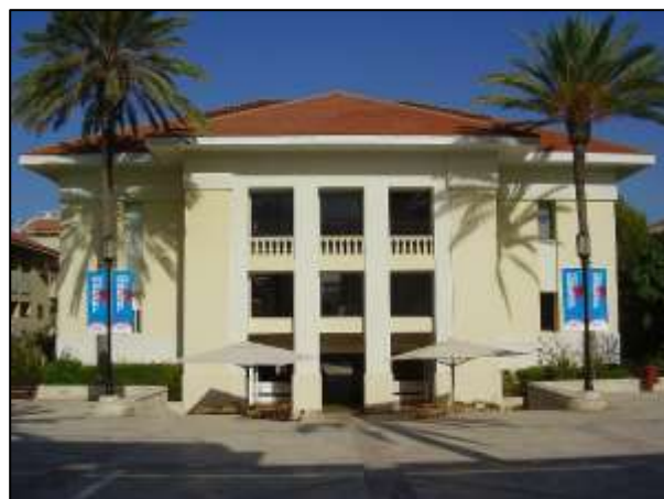
איור 11: בניין בית הספר הישן (1908) לבנים שהפך בית לשלוש להקות מחול ומרכז לכנסים