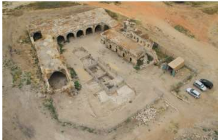
איור 13: שרידי ח'אן אל-חילו העותומאני בלוד