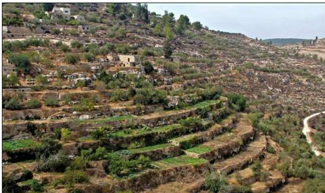
איור 3: נוף תרבות חקלאית: הטרסות החקלאיות ליד הכפר בתיר, הרי יהודה